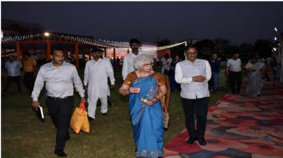
अतिथि गृह के लिए प्रस्थान