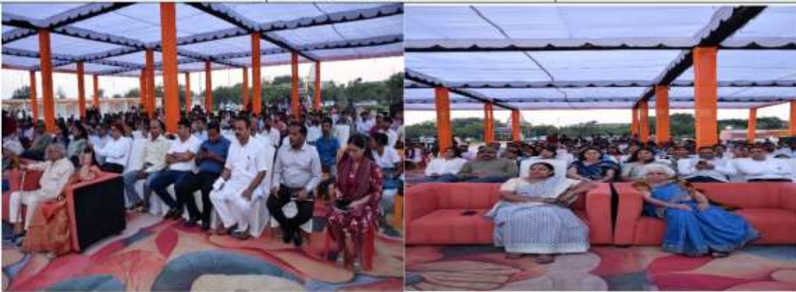
लोक नृत्य प्रतियोगिता