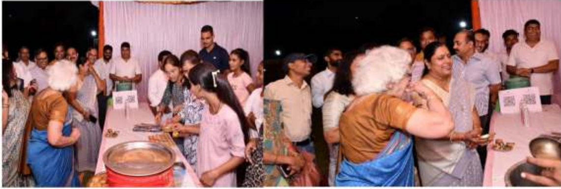
पानी पूरी स्टाल का आनंद उठाती अतिथि