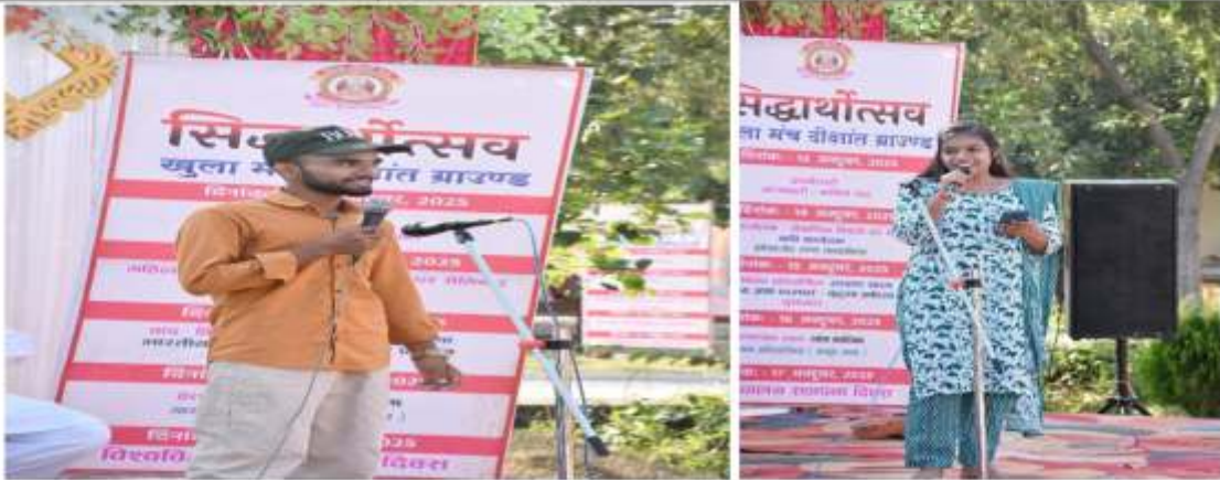
वाद विवाद प्रतियोगिता