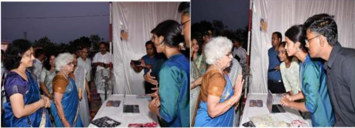
छात्रों द्वारा स्वयं के निर्मित डिज़ाइनर कपडे