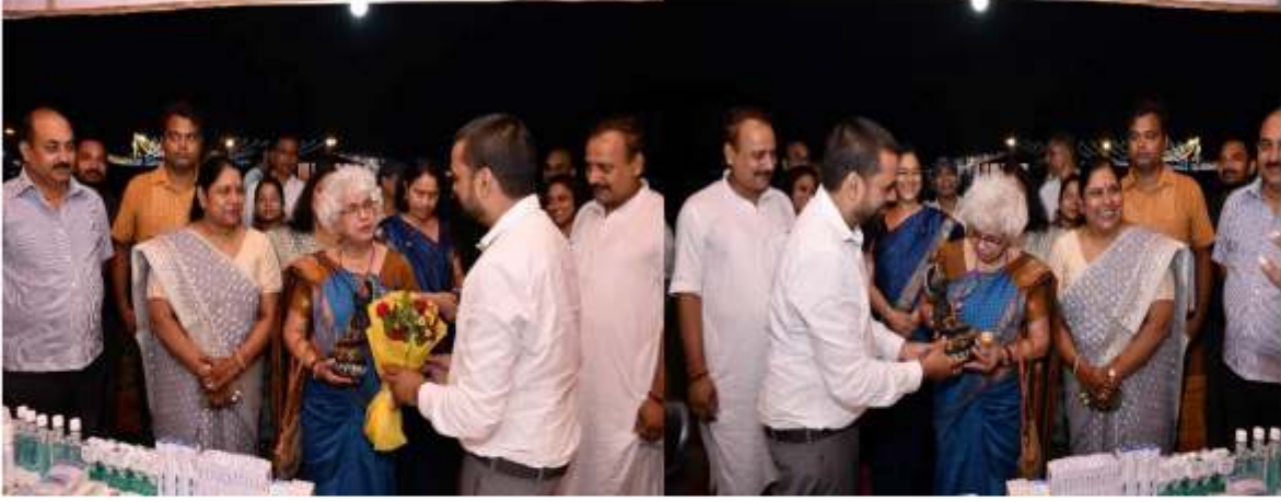
दन्त चिकित्सा शिविर में अतिथि स्वागत गुलदस्ता एवं स्मृति चिन्ह भेंट