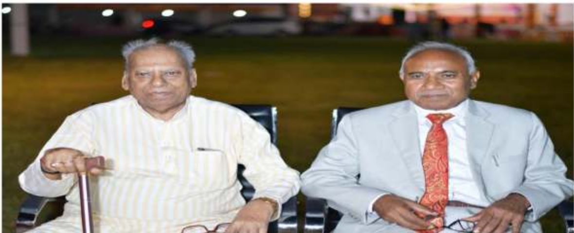
छात्रों के कार्यक्रम का आनंद लेते अतिथि