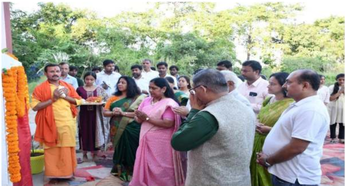
विधि संकाय भवन का लोकार्पण जस्टिस अनिरुद्ध सिंह द्वारा