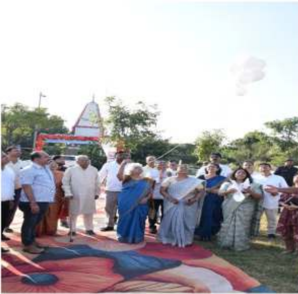
सफ़ेद गुब्बारे शांति का प्रतीक कबूतर , अतिथि स्वागत