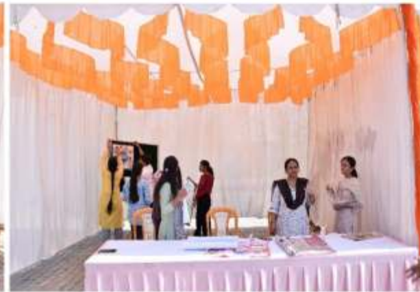
स्टाल लगाते छात्र छात्राएं