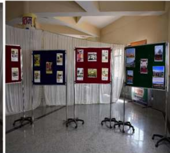
डाक्यूमेंट्री एवं फोटो प्रदर्शनी