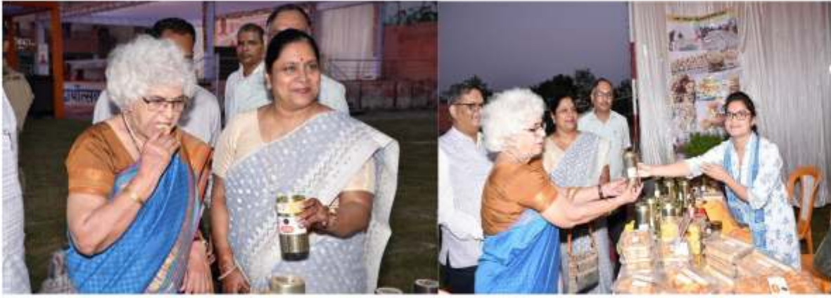
बिस्कुट का स्वाद लेतीं अतिथि