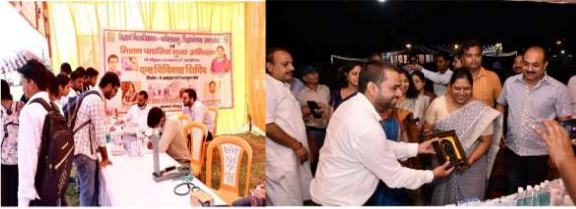
छात्रों द्वारा चिकित्सक से परामर्श