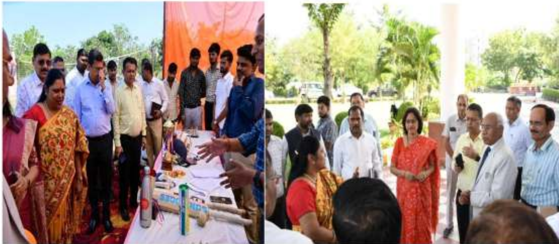
पुरातन छात्र सम्मिलन