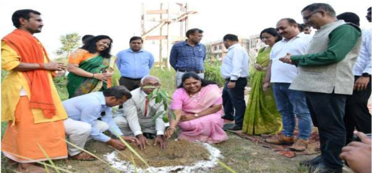
विधि संकाय प्रांगण में पौधा रोपण