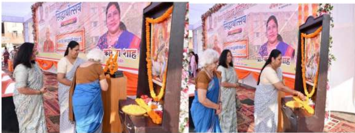
माँ सरस्वती एवं भगवन बुद्ध की प्रतिमा पर पुष्पार्चन