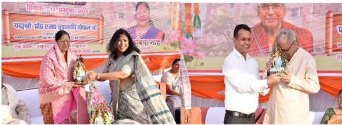
विशिष्ट अतिथियों का स्वागत