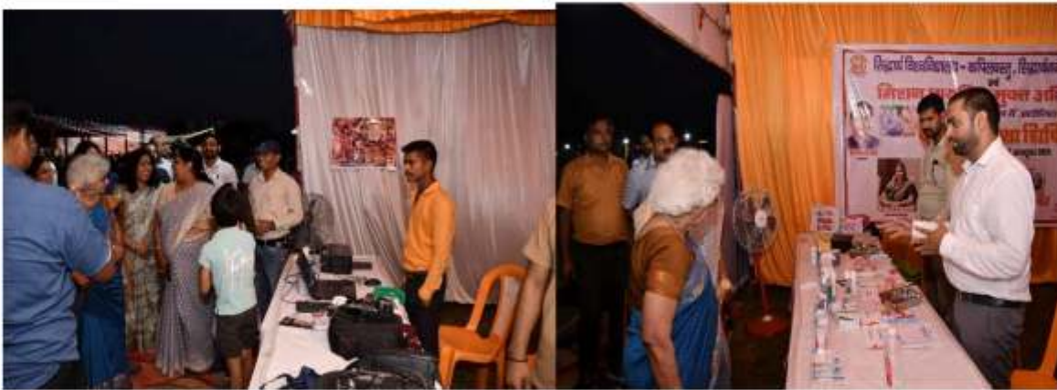
फोटोग्राफी तकनीकी स्टाल