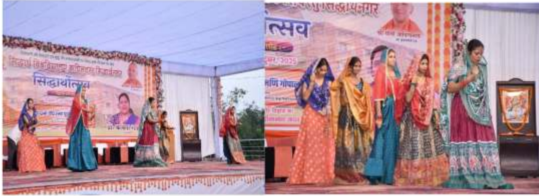
लोक नृत्य प्रतियोगिता