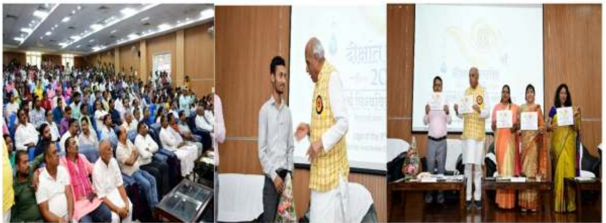
दीक्षांत लोगो के निर्माण करने वाले छात्र को पुरस्कार व सम्मान