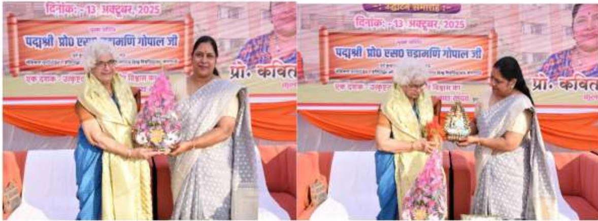
माननीय कुलपति जी द्वारा अतिथियों का स्वागत सत्कार