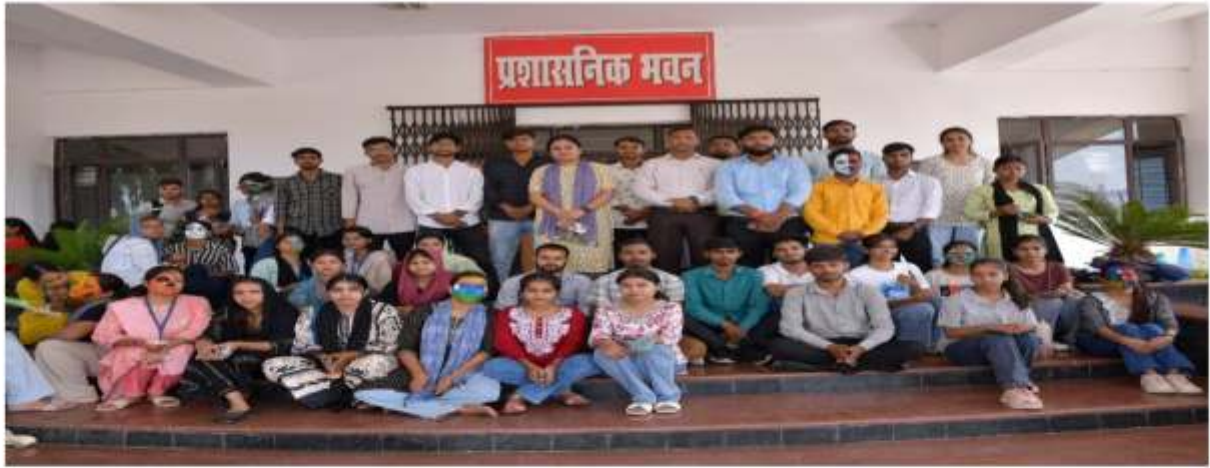
फेस पेंटिंग प्रतियोगिता