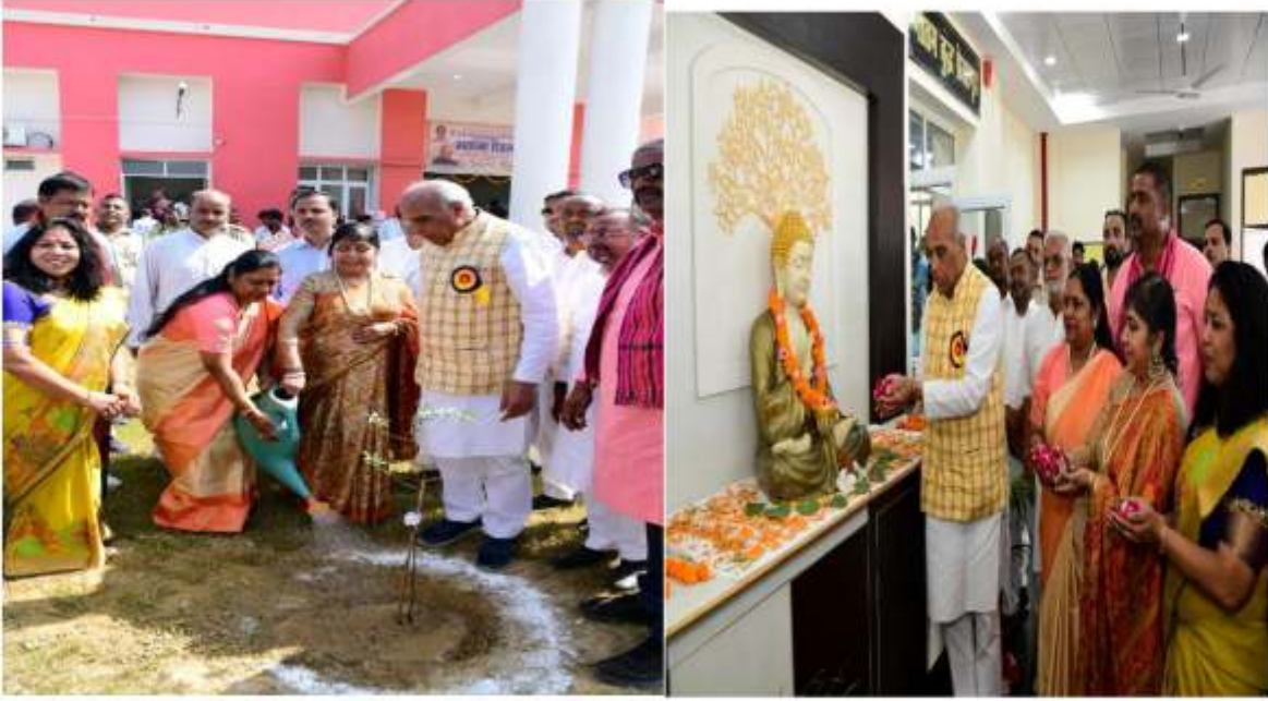
चन्दन के पौधे का रोपण - स्थापना दिवस के शुभ अवसर पर