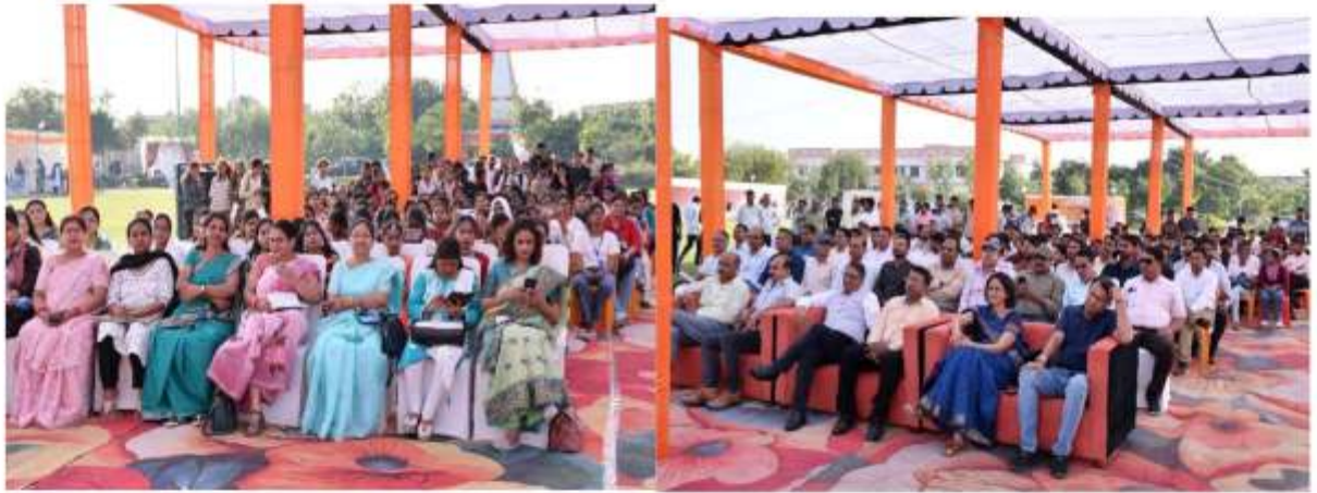
पंडाल में उपस्थित शिक्षक छात्र छात्राएं