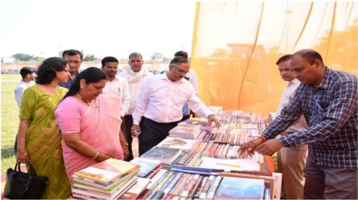
पुस्तक मेला उद्घाटन सत्र की झलकियां