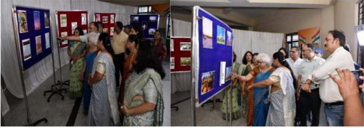
वन्य जीव फोटोग्राफी प्रदर्शनी