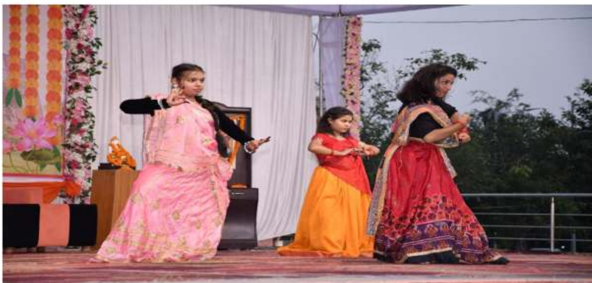
अर्धनारीश्वर की सुन्दर प्रस्तुति