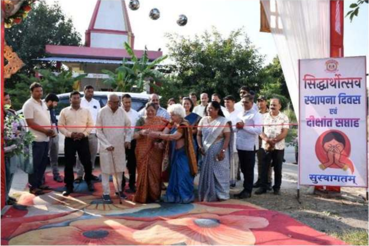
मुख्य अतिथि द्वारा फीता काट कर प्रदर्शनी का शुभारम्भ