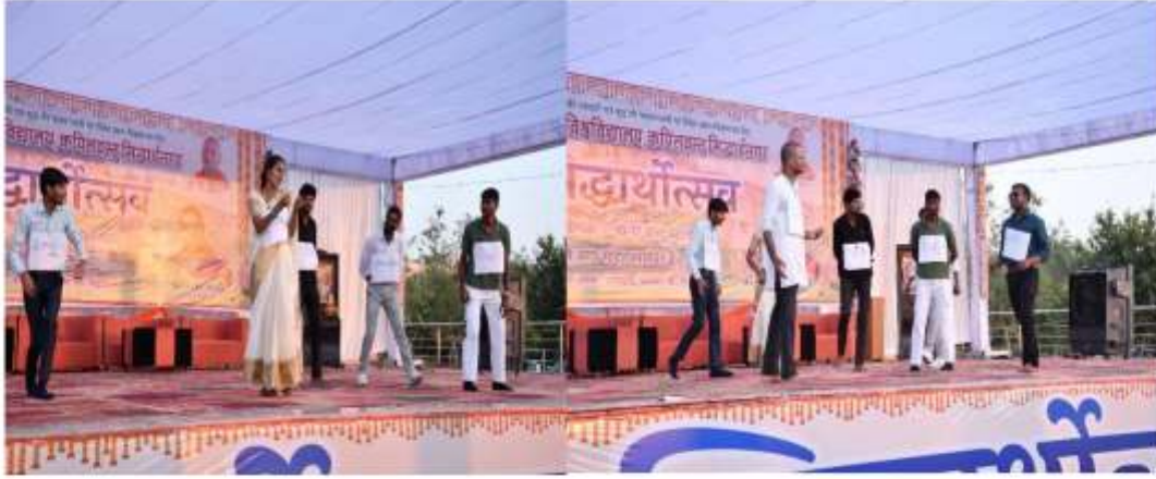
छात्रों द्वारा मोबाइल और इंटरनेट की दुनिया पर व्यंग नाटिका