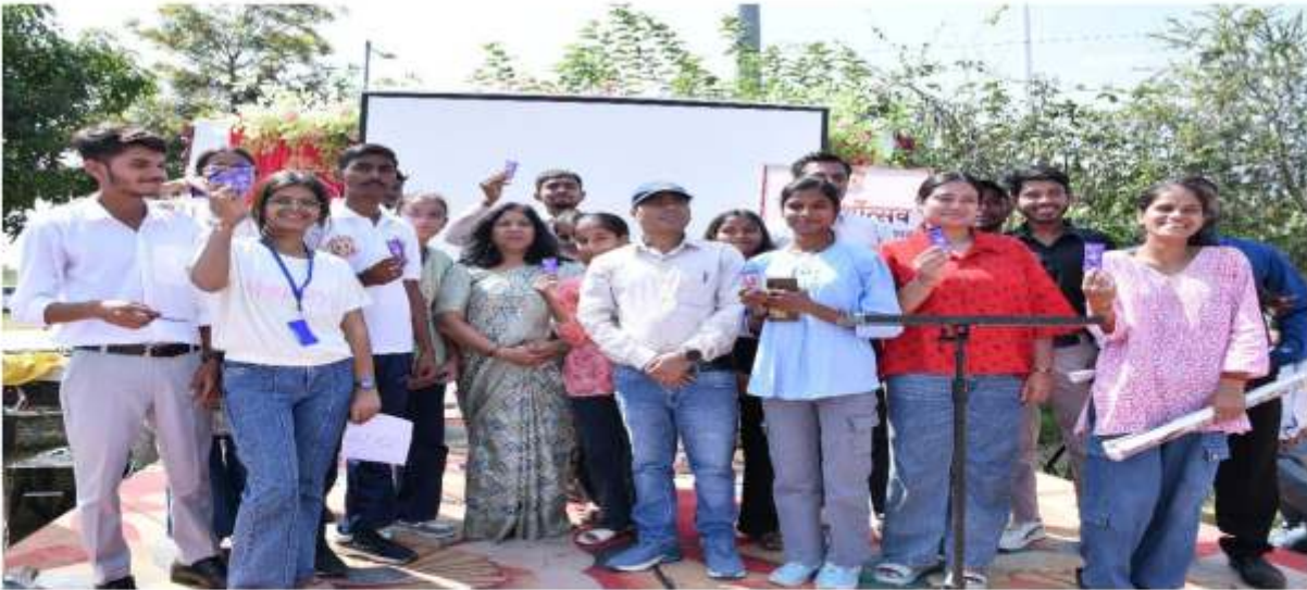
प्रश्नोत्तरी में प्रतिभाग करने वाले छात्र