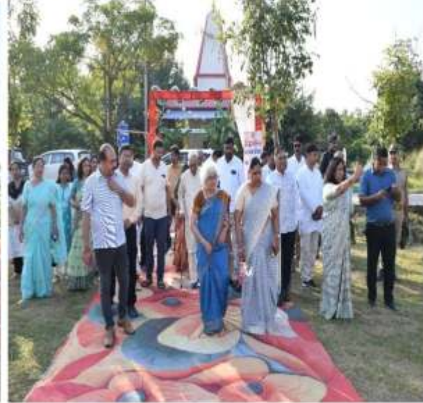
प्रदर्शनी क्षेत्र में माननीय कुलपति जी द्वारा