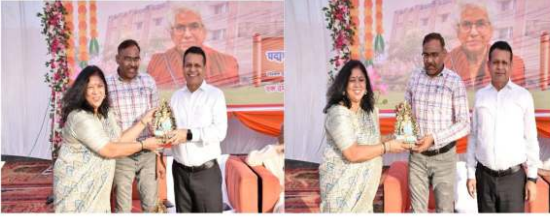
कुलसचिव व वित्त अधिकारी जी का स्वागत